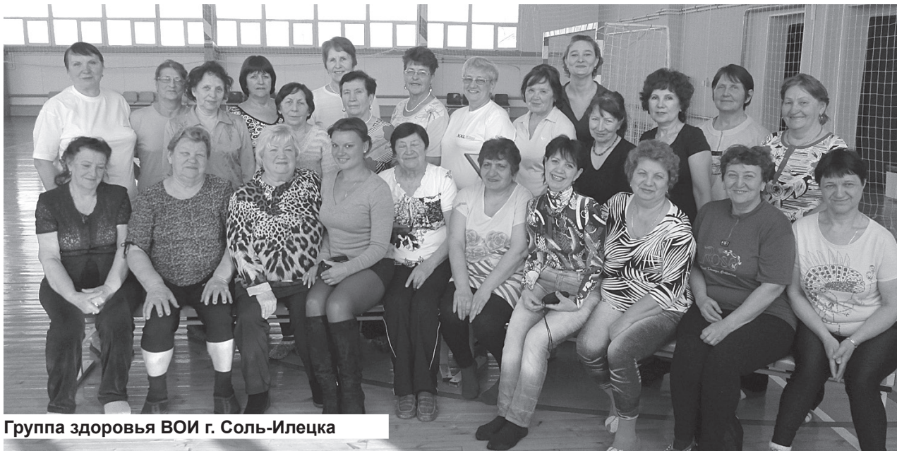
Группа здоровья ВОИ г. Соль-Илецка

маем участие в областной спартакиаде среди лиц с ограниченными возможностями. Ежегодно проводим фестивали творчества инвалидов «Вместе мы сможем больше», где инвалиды выставляют свои работы - вышивки, вязаные вещи, игрушки, всевозможные поделки. Участники фестиваля награждаются дипломами и подарками. Принимаем участие и в областном фестивале творчества инвалидов.