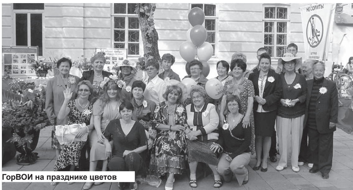
ГорВОИ на празднике цветов