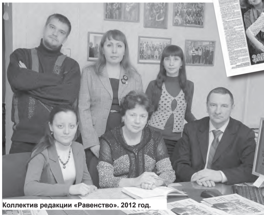
Коллектив редакции «Равенство». 2012 год.