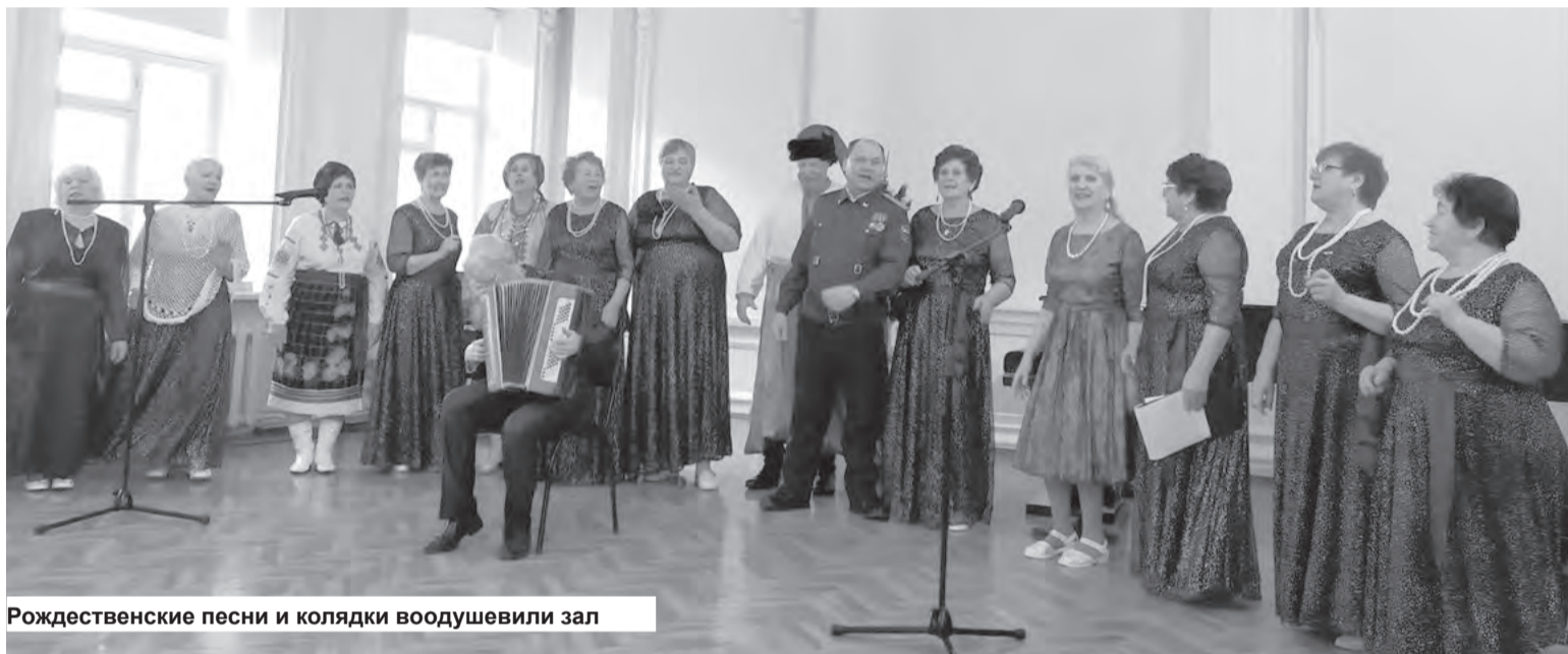
Рождественские песни и колядки воодушевили зал