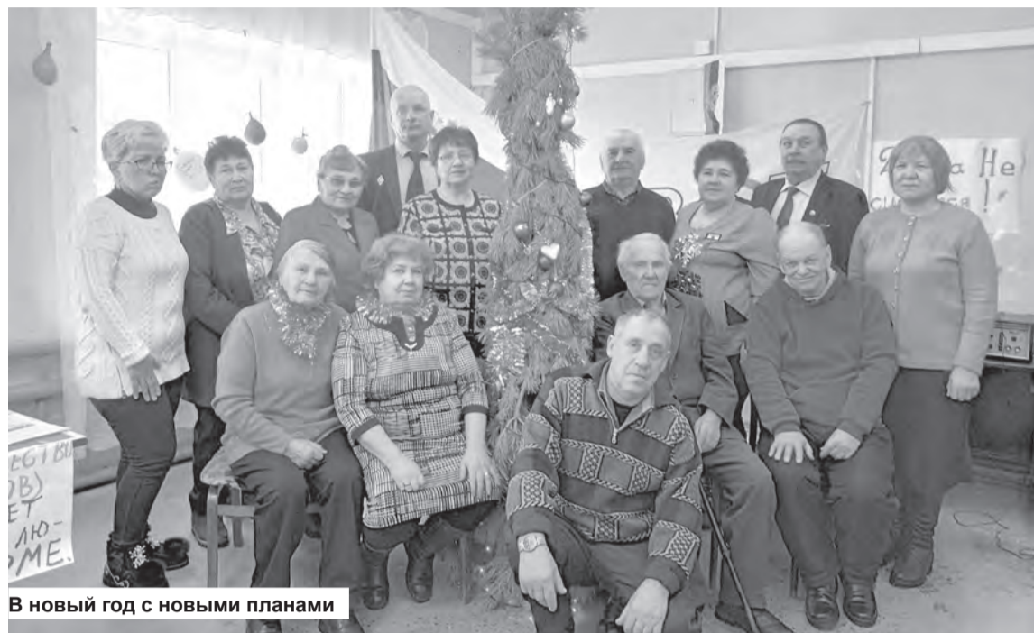
В новый год с новыми планами

Именно с таким названием 13 января прошёл в местной организации ВОИ праздник, посвящённый Старому Новому году. Посидеть в кругу друзей, водить хоры, попроситься с ёлочкой – это то немногое, что изначально планировалось.