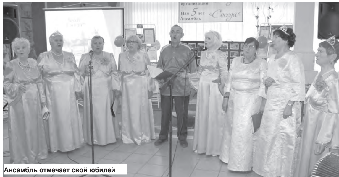
Ансамбль отмечает свой юбилей