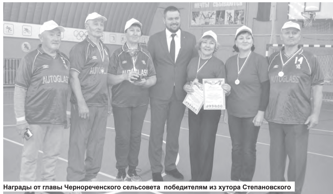
Награды от главы Чернореченского сельсовета победителям из хутора Степановского

ить школы и детские сады. За четыре года в районе построены 16 таких социально-значимых объектов. И всё это – благодаря нашей с вами совместной работе. Замечательный лозунг спартакиады