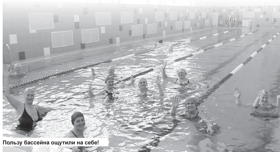
Пользу бассейна ощутили на себе!

Для членов клуба «Здоровье» людей старшего поколения села Пономарёвка плавание – это возможность общения и укрепления здоровья. Прелесть плавания в том, что оно может способствовать достижению одновременно самых разных целей – как оздоровительных, так и эстетических.