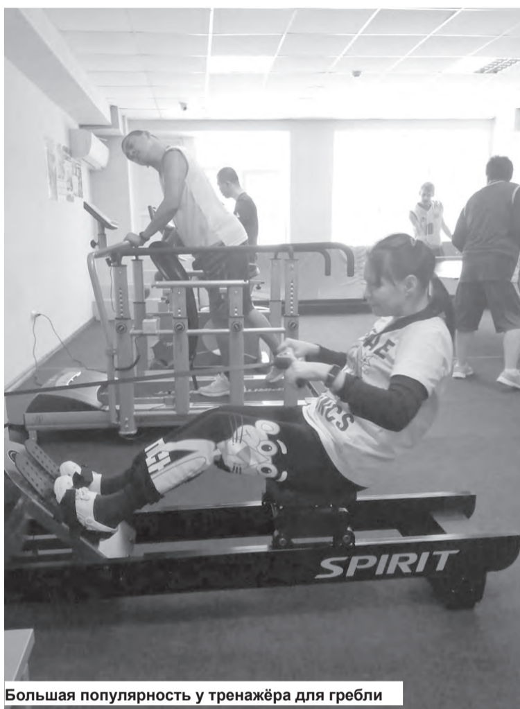
Большая популярность у тренажёра для гребли