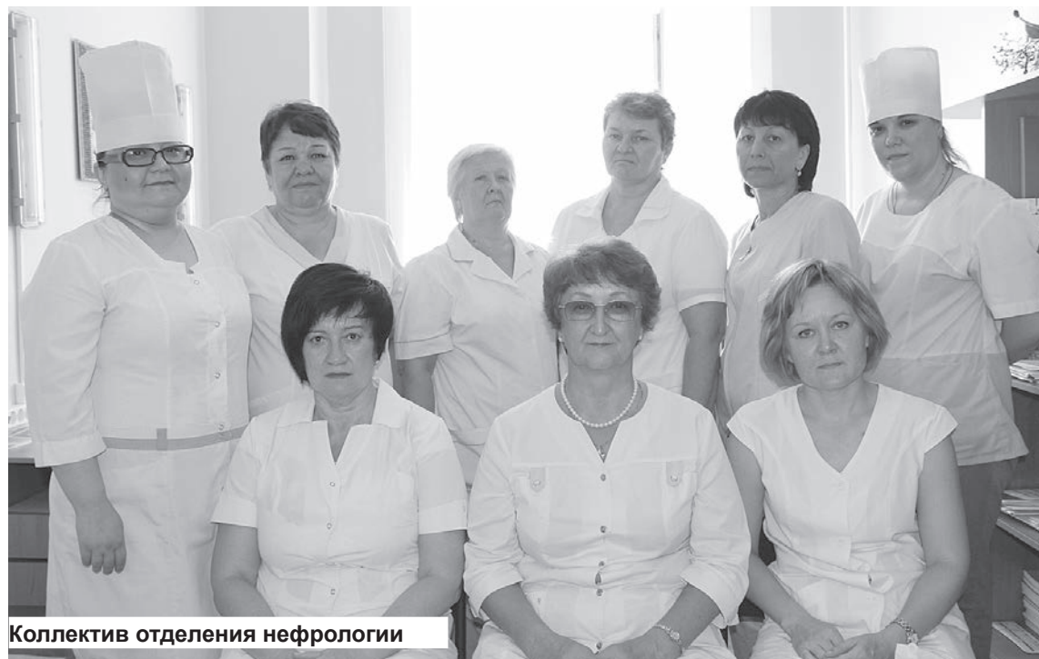
Коллектив отделения нефрологии