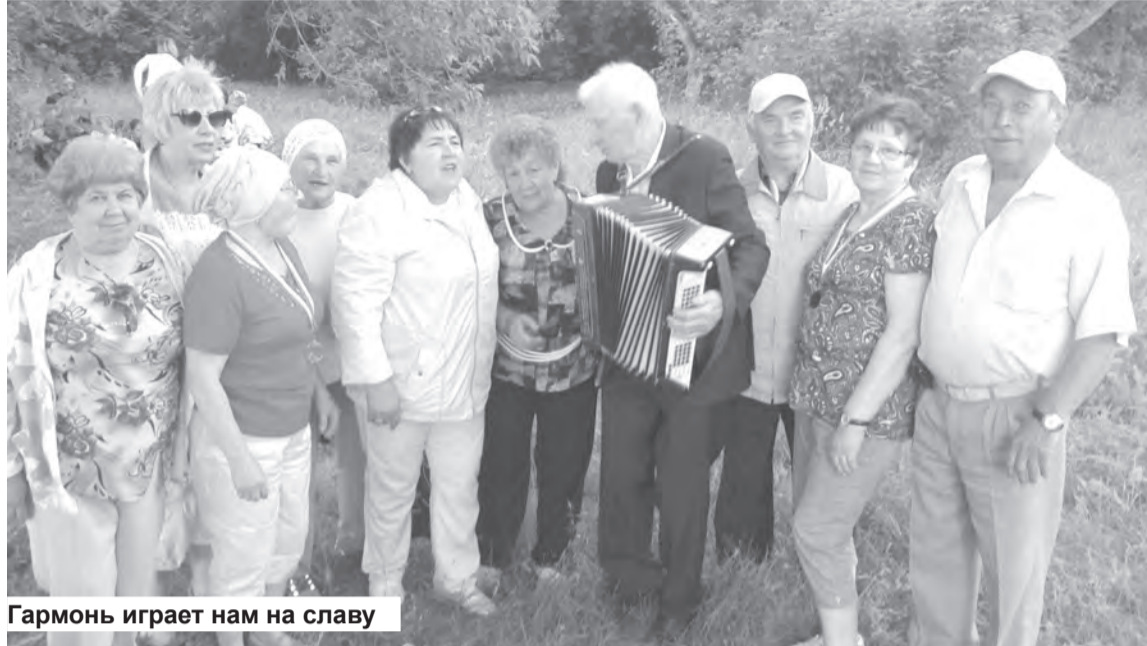
Гармонь играет нам на славу

мишень, она уверенно попадала в яблочко, в итоге заняла первое место на пьедестале, поделив его с