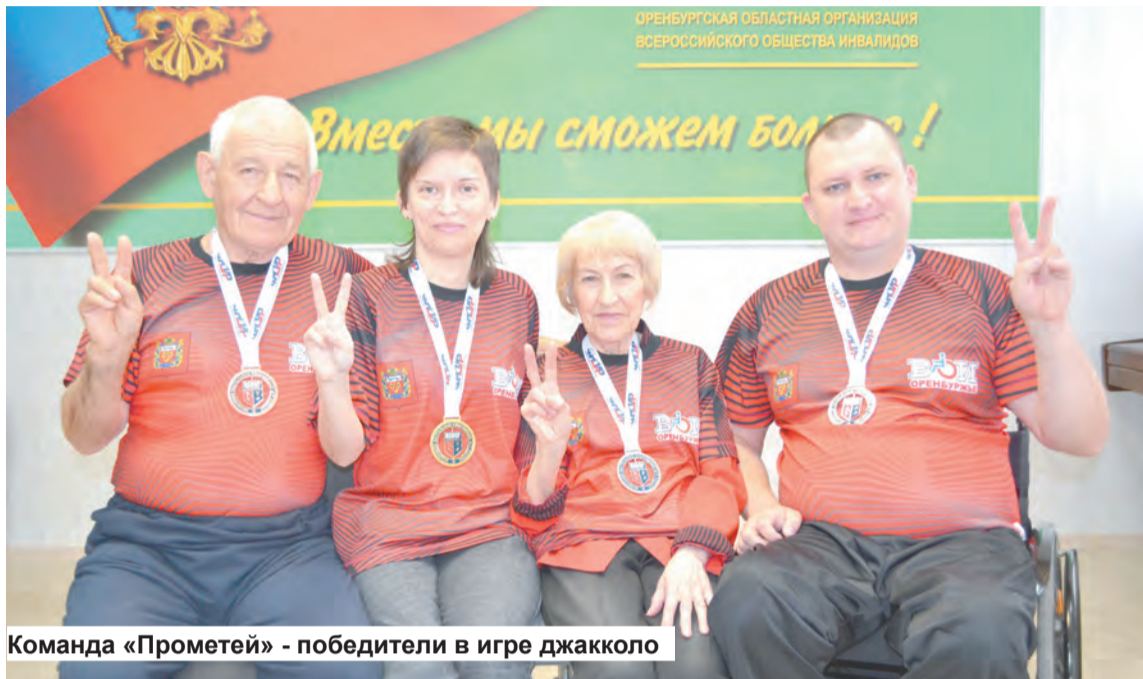
Команда «Прометей» - победители в игре джакколо

Наши спортсмены в очередной раз подтвердили свой высокий уровень мастерства, заняв львиную долю призовых мест в двух чемпионатах