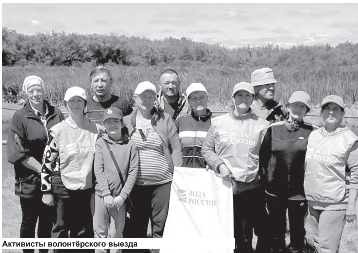
Активисты волонтерского выезда

Зоны отдыха сразу приобрели нарядный, красочный вид.