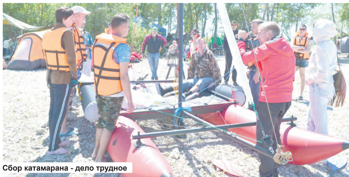
Сбор катамарана - дело трудное

Вот так разнообразно, ярко, насыщенно прошли пять дней. Расставаясь, ребята обменивались контактами, обнимались друг с другом и обещали вновь собраться вместе при первой же возможности. Ну, а общение их продолжилось сразу по приезду домой: телефоны, социальные сети – в помощь.