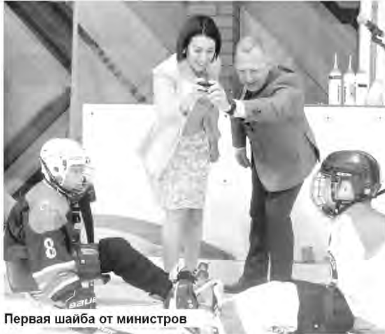
Первая шайба от министров

Волжане забросили единственную шайбу в ворота оренбуржцев и не дали «Ястребам» «распечатать» саратовские ворота. Моментов для взятия ворот гостей у сledge-хоккеистов из Оренбурга было немало, но шайба