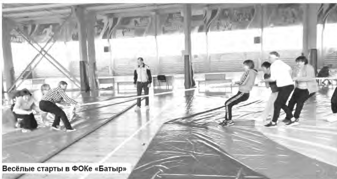
Весёлые старты в ФОКе «Батыр»