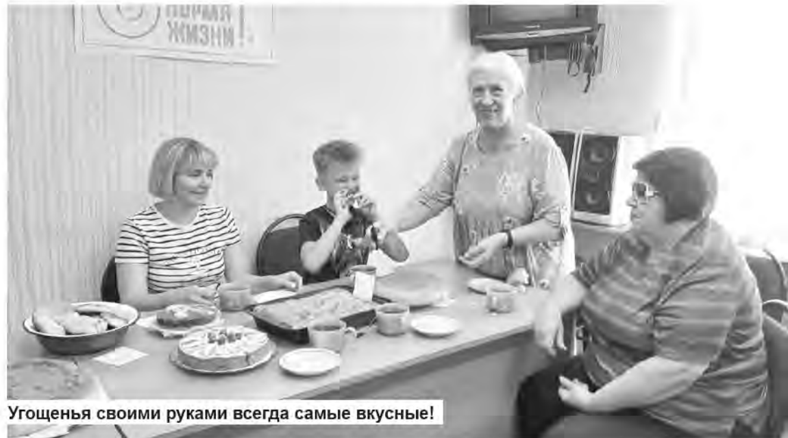
Угощения своими руками всегда самые вкусные!

Задача у членов жюри, в состав которого вошли представители городского Совета ветеранов и правления Бузулукского отделения ВОИ, оказалась непростой. Курник просто таял во рту, пирог с луком и яйцом был