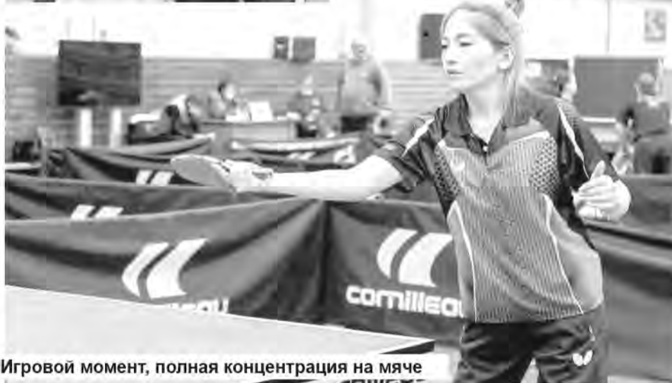
Игровой момент, полная концентрация на мяче

многое умеют. Они ловко обращаются с ракеткой, у них уже прорезалась игра накатом, они бьют достаточно сильно. То есть они серьёзные спарринг-партнёры. После занятий с ними чувствуешь, что получила запас энергии.