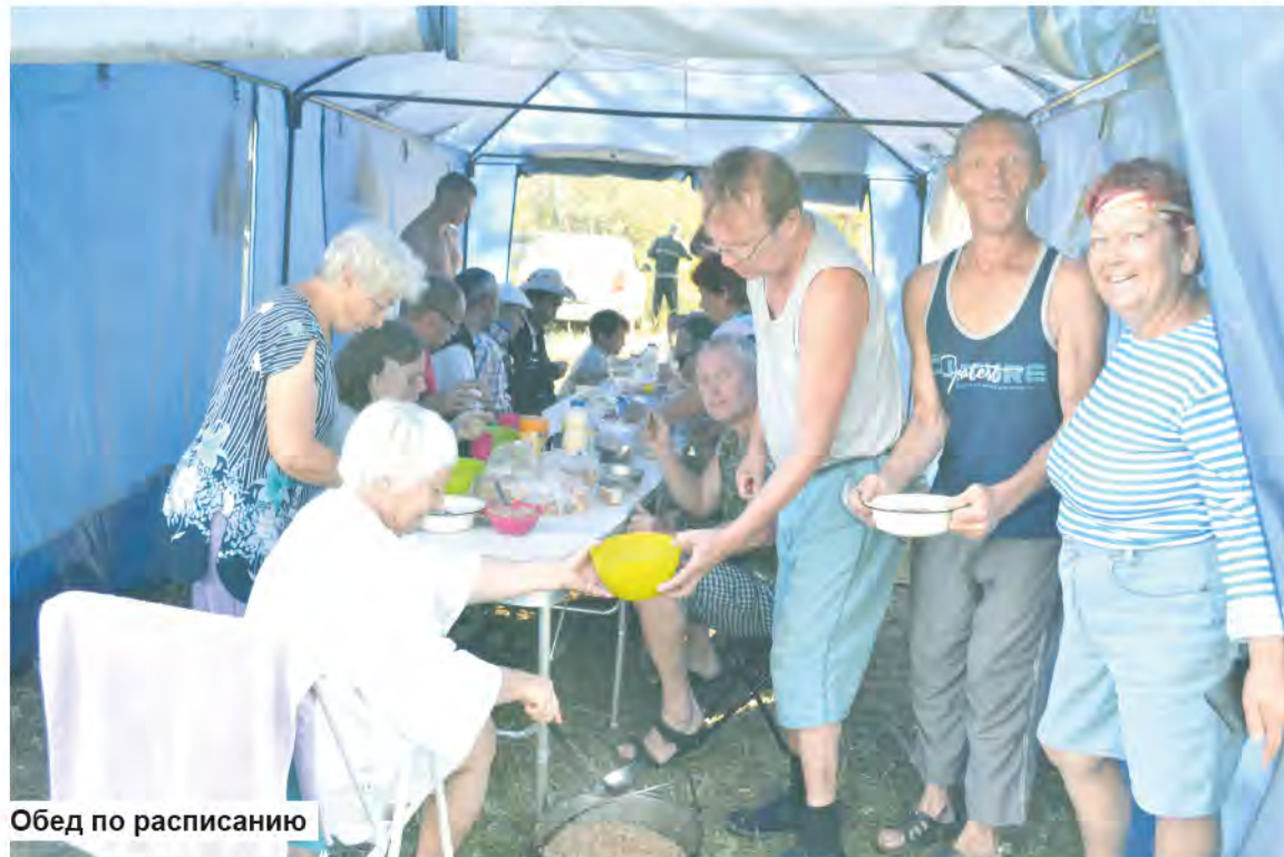
Обед по расписанию