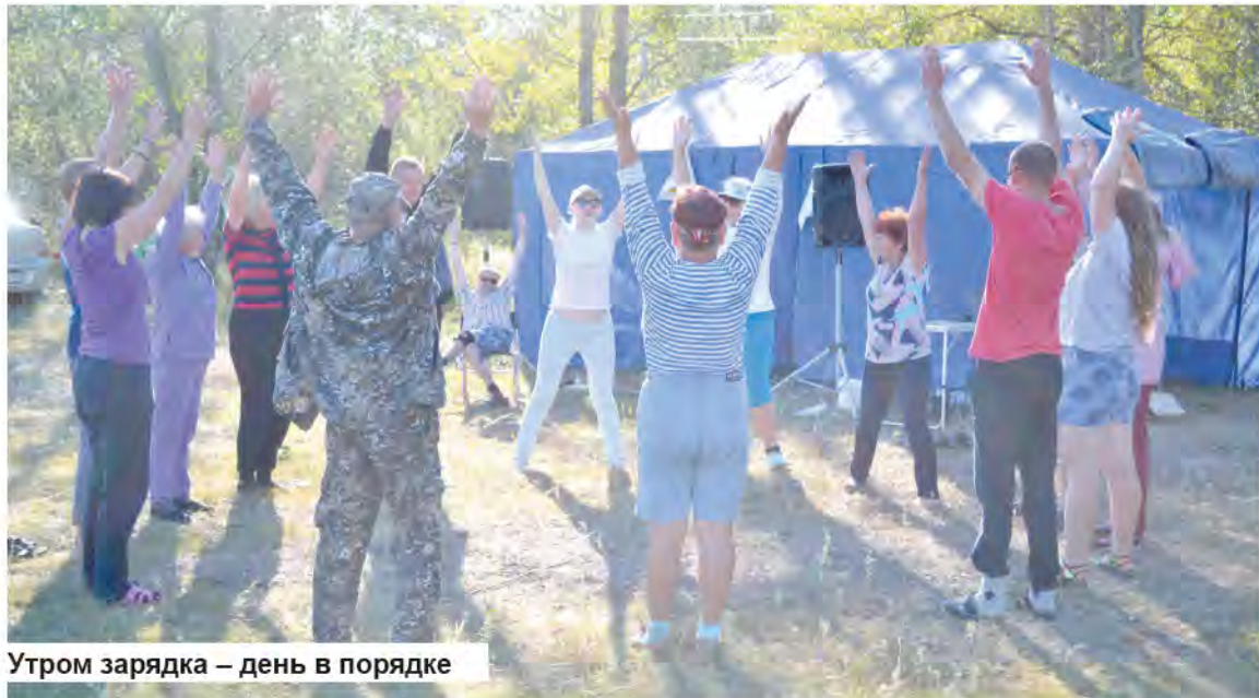
Утром зарядка – день в порядке