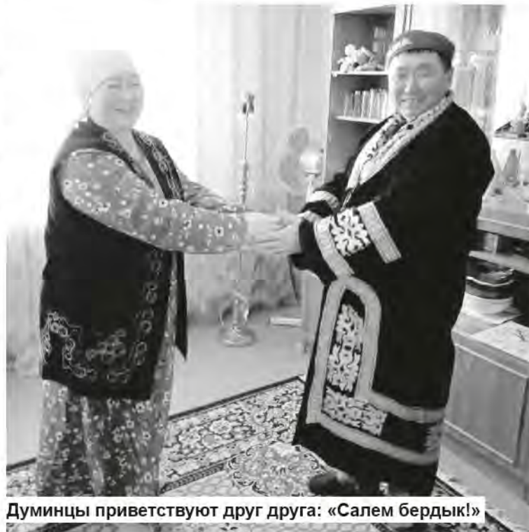
Думинцы приветствуют друг друга: «Салем бердык!»