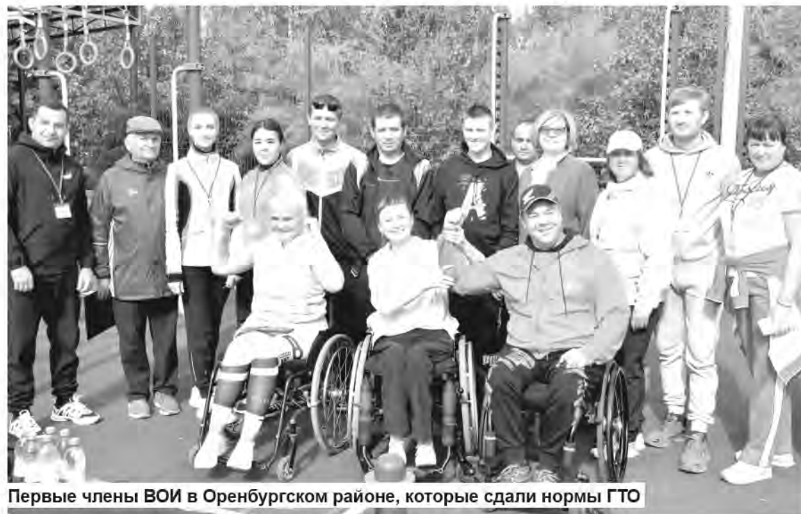
Первые члены ВОИ в Оренбургском районе, которые сдали нормы ГТО

Участники фестиваля интересно и с пользой провели время, пообщались с единомышленниками. Итоги сдачи нормативов будут подведены позже, и все спортсмены получат заслуженные награды.