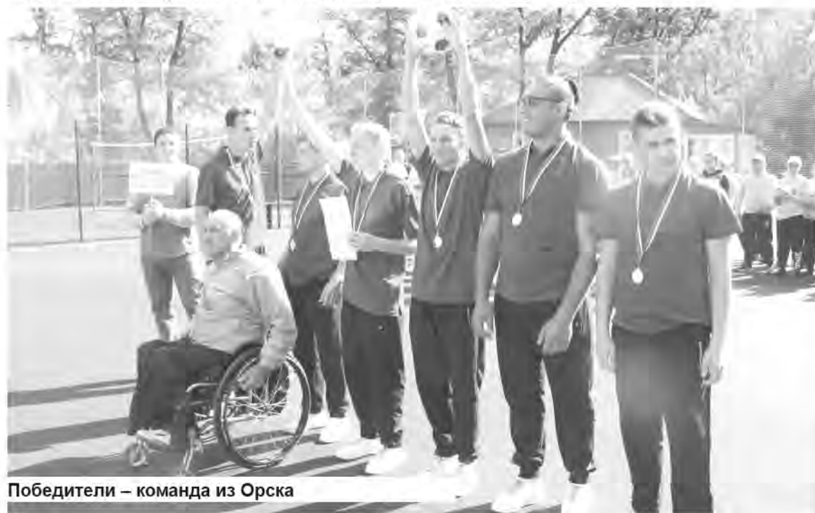
Победители – команда из Орска