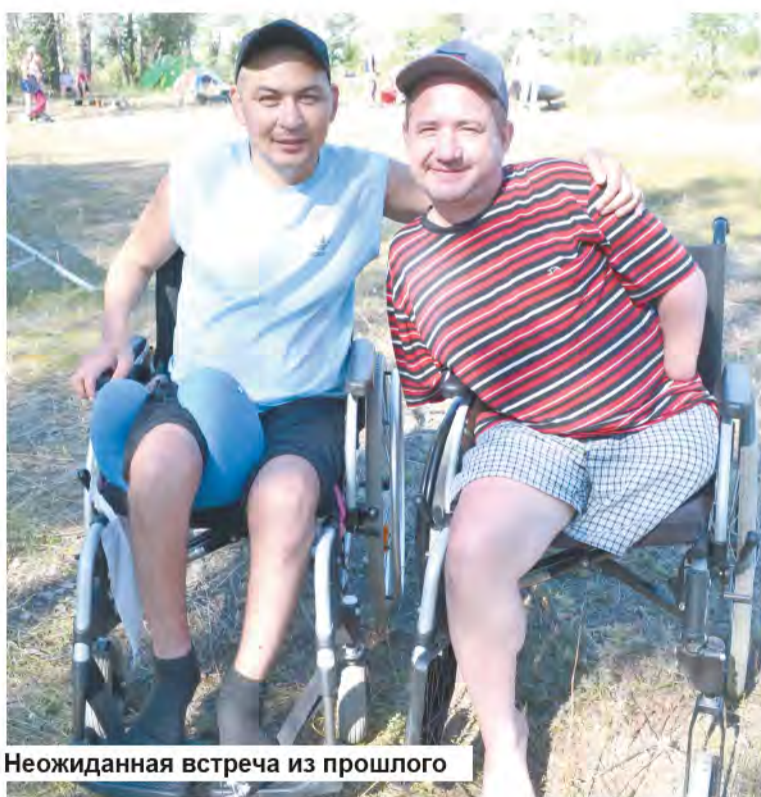
Неожиданная встреча из прошлого

вернувшего всю его жизнь и «усадившего» в коляску, было очень тяжело.