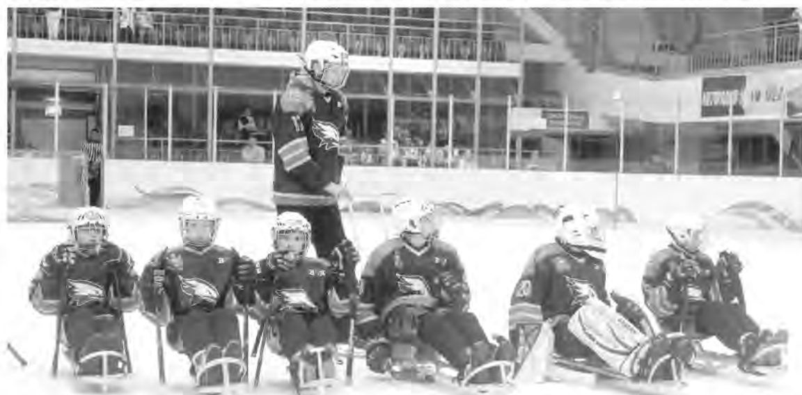
Юные хоккеисты перед началом игры