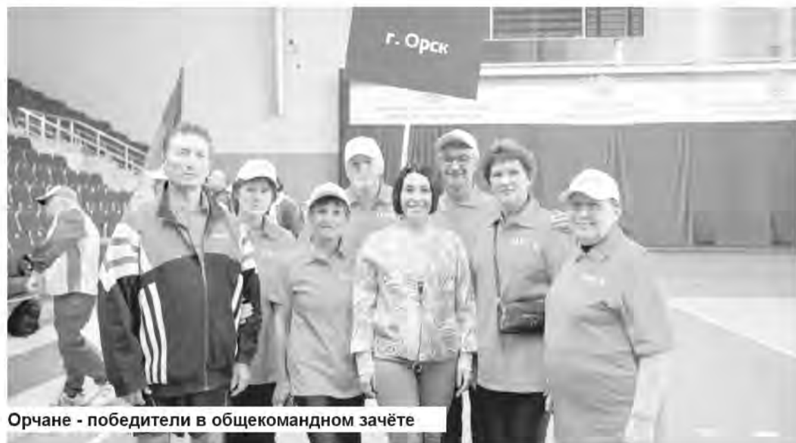
Орчане - победители в общекомандном зачёте

Более 150 спортсменов серебряного возраста – женщины от 55 лет и мужчины от 60, представлявших 17 команд муниципальных образований региона прибыли в областной центр, чтобы принять участие в состязаниях, помериться силами и пообщаться с добрыми знакомыми и друзьями.