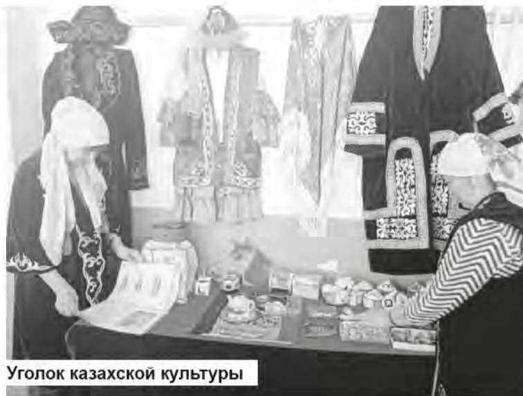
Уголок казахской культуры