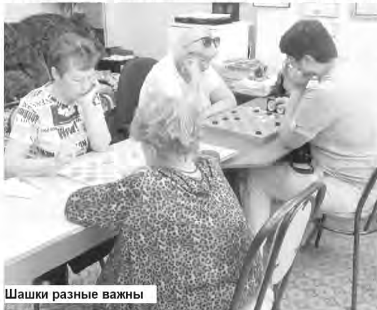
Шашки разные важны