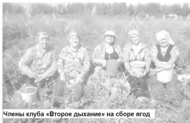
Члены клуба «Второе дыхание» на сборе ягод