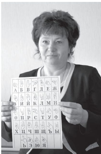
жизни. Приемный день в обществе – среда, с 9 до 17 часов.