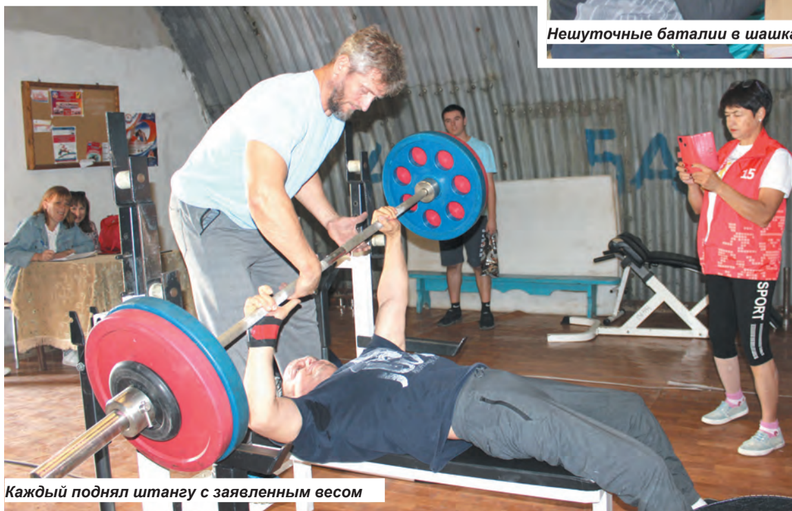
Каждый поднял штангу с заявленным весом

поэтому результаты были отличными. В пауэрлифтинге каждый спортсмен поднял штангу с заявленным весом. Поэтому тут все получили призовые места.