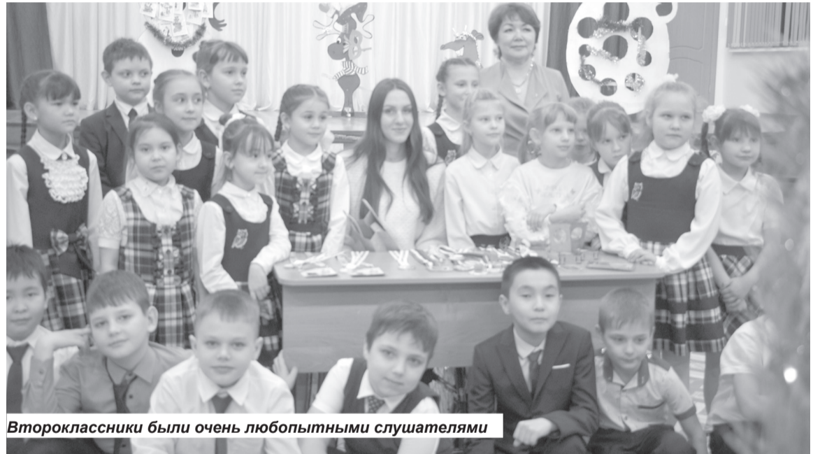
Второклассники были очень любопытными слушателями

Победительница многих международных спортивных