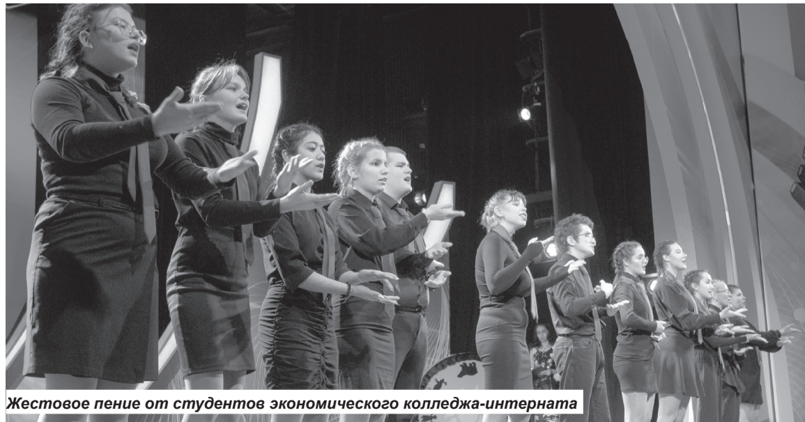
Жестовое пение от студентов экономического колледжа-интерната