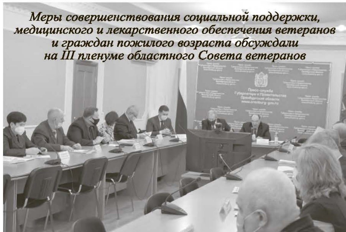
Меры совершенствования социальной поддержки, медицинского и лекарственного обеспечения ветеранов и граждан пожилого возраста обсуждали на III пленуме областного Совета ветеранов

– Всё больше представителей старшего поколения вовлекаются в культурно-досу-