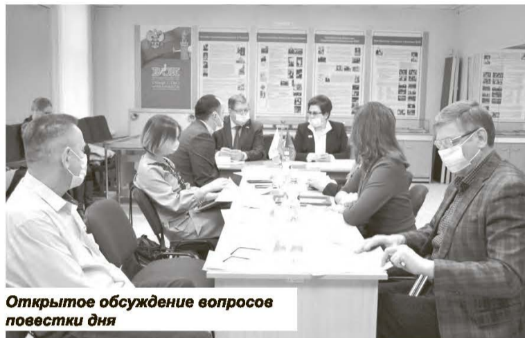
Открытое обсуждение вопросов повестки дня

Право на бесплатное обеспечение ТСР имеют инвалиды и участники Великой Отечественной войны, дети-инвалиды, инвалиды, проживающие в семьях, имеющих в своем составе двух и более инвалидов, люди с ограниченными возможностями здоровья, имеющие рекомендации ИПРА об обеспечении инвалида ТСР (без учёта размера среднедушевого дохода), малообеспеченные граждане с ОВЗ. Причем инвалиды и участники ВОВ обеспечиваются ТСР во внеочередном порядке.