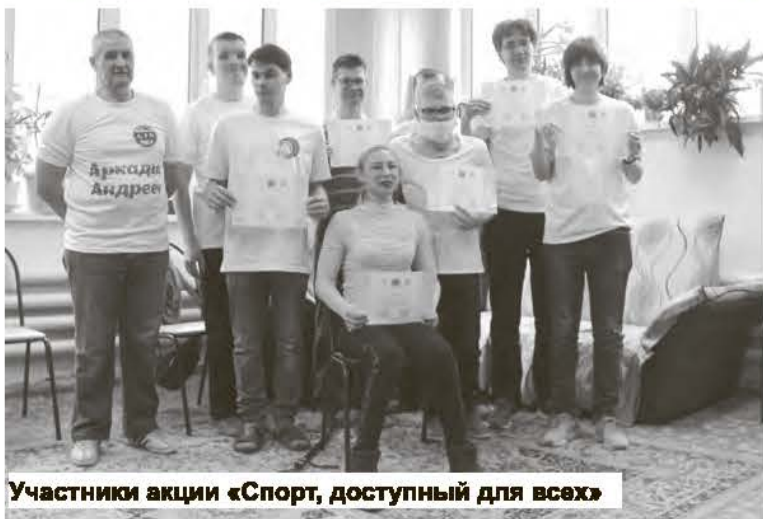
Участники акции «Спорт, доступный для всех»