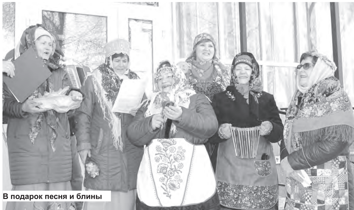
В подарок песня и блины