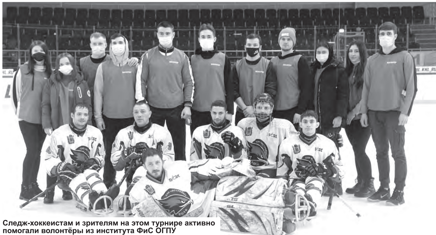
Следж-хоккеистам и зрителям на этом турнире активно помогали волонтеры из института ФИС ОГПУ