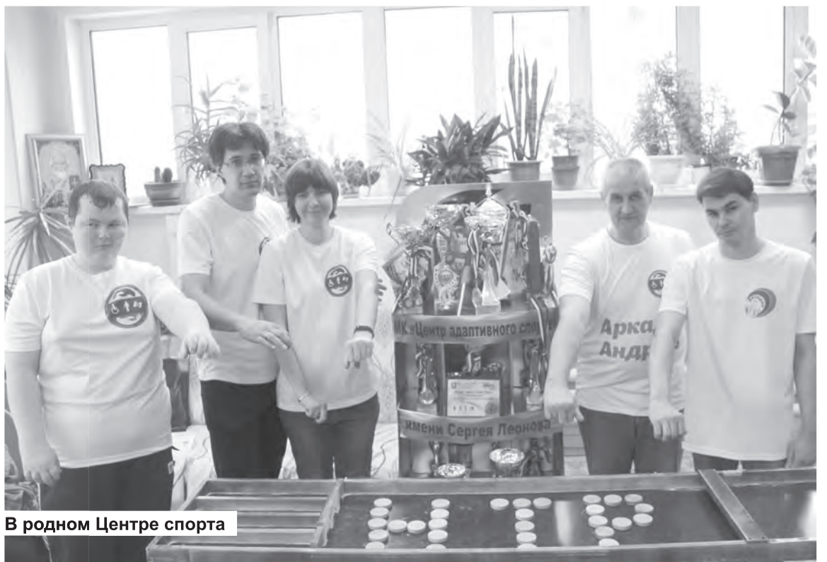
В родном Центре спорта