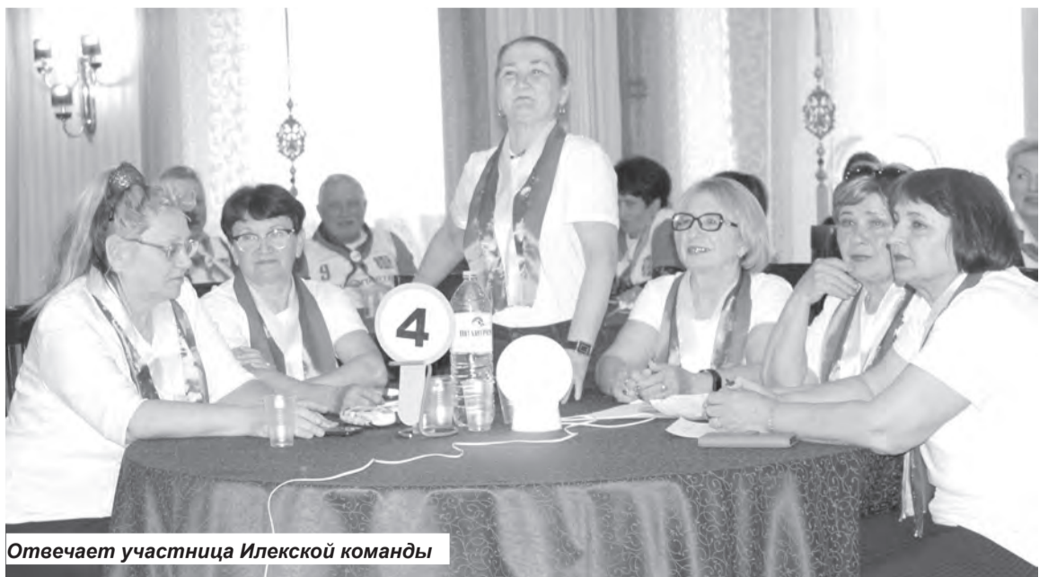
Отвечает участница Илекской команды