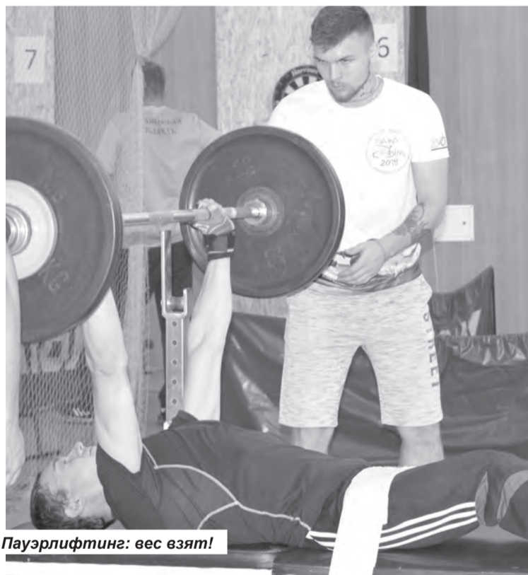
Пауэрлифтинг: вес взят!