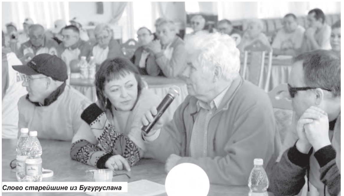
Слово старейшине из Бугуруслана

По итогам игры первое место завоевала команда из Новотроицка, второе место у Медногорска, орская команда заняла третье место. За