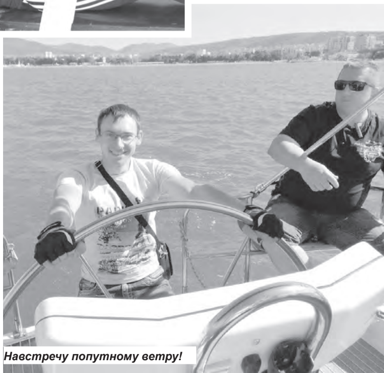
Навстречу попутному ветру!