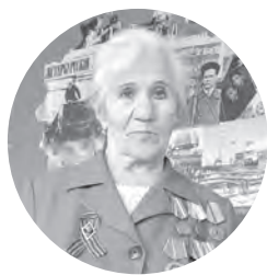
автор Людмила ЛАВРЕНТЬЕВА г. Оренбург