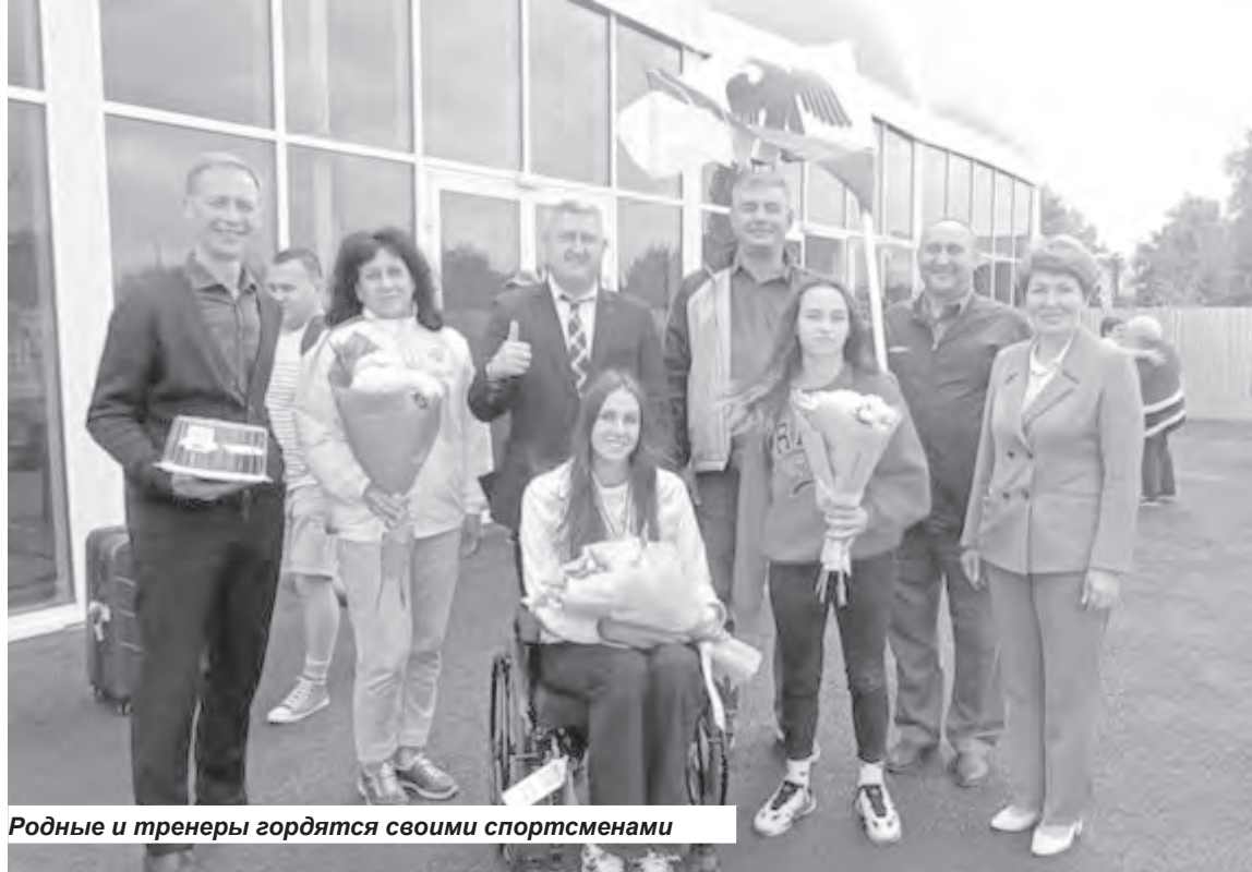
Родные и тренеры гордятся своими спортсменами

На Летних играх паралимпийцев оренбургские спортсмены открыли счёт медалям.