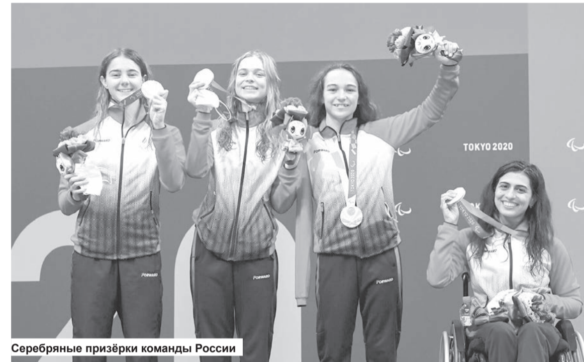
Серебряные призёрки команды России

Юная пловчиха из Орска в Токио прилетела четырёхкратной чемпионкой Европы,