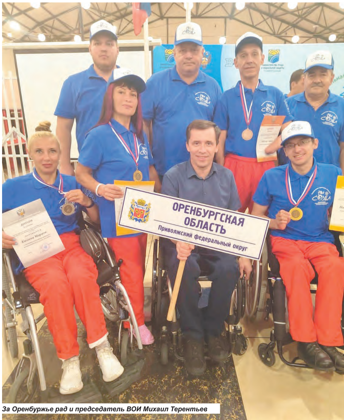
За Оренбуржье рад и председатель ВОИ Михаил Терентьев

– Пять лет назад врач посоветовал мне подкачать мышцы на ногах. Так я пришла в спортзал и хожу до сих пор. Занятия физкультурой очень помогают мне. Это особое состояние тела и души. Три раза в неделю я занимаюсь в тренажёрном зале, затем плаваю в бассейне. Благодаря занятиям нашла много друзей, да и здесь общение важнее всего. Это окрыляет и до-