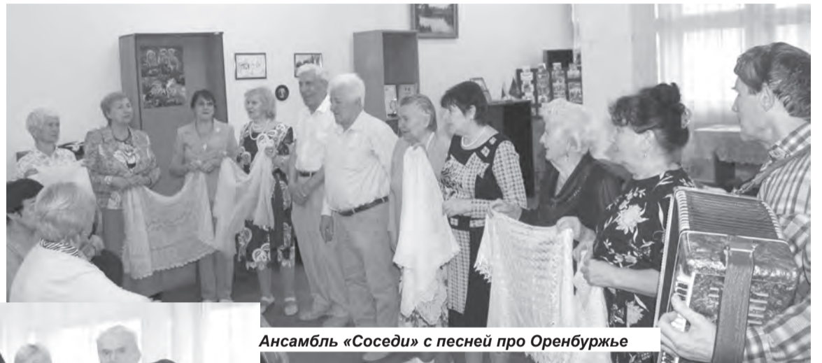
Ансамбль «Соседи» с песней про Оренбуржье

Уютно в компании старших было и молодому депута-