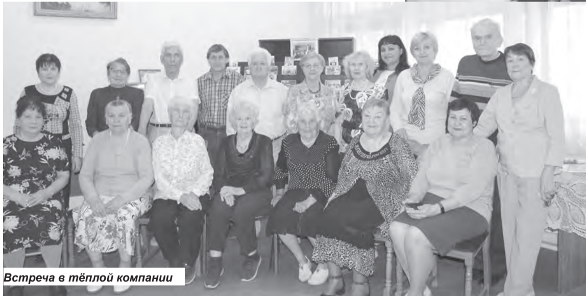
Встреча в тёплой компании