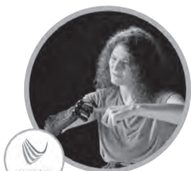
Бионические кисти Vincent Systems