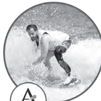
Протезные чехлы ALPS