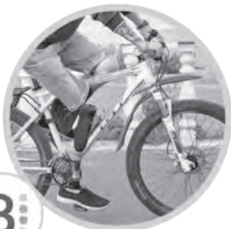
Современные протезы для ног Blatchford