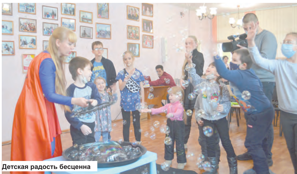
Детская радость бесценна