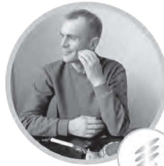
Косметические протезы и модули Regal