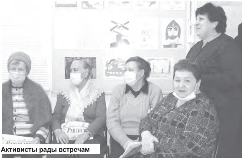
Активисты рады встречам