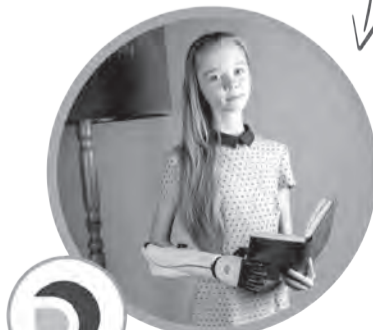
Бионические руки Open Bionics