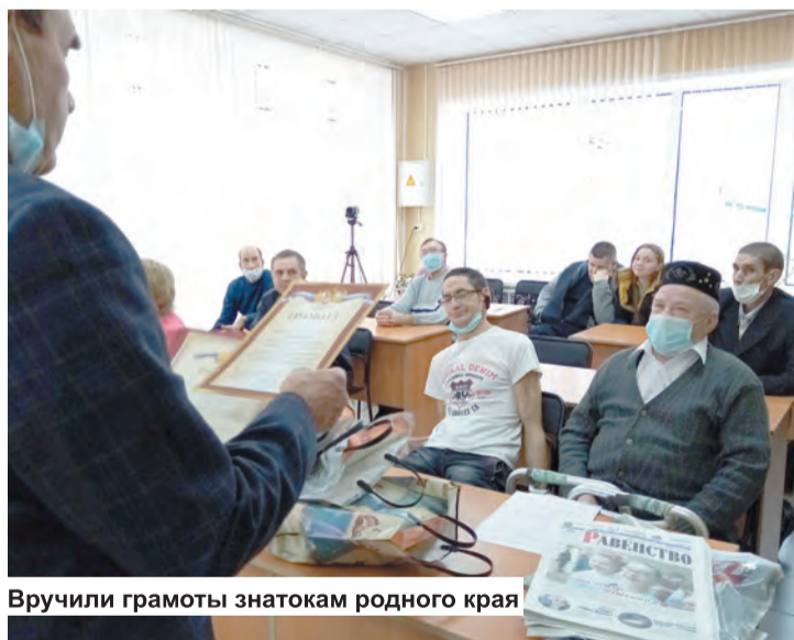
Вручили грамоты знатокам родного края