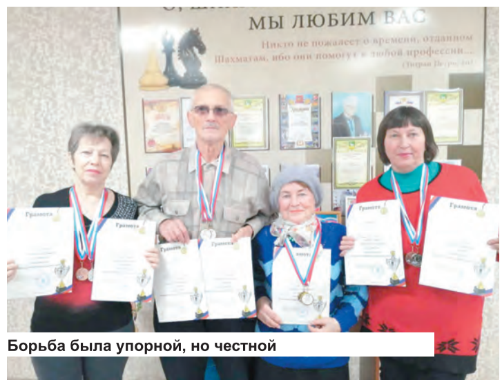
Борьба была упорной, но честной