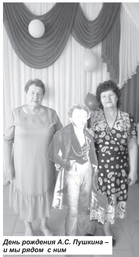
День рождения А.С. Пушкина – и мы рядом с ним

Чтобы веселее было жить, одно из заседаний правления провели на «красном» роднике в селе Филипповка. Посетили местный музей, а затем организовали чаепитие. Подобное