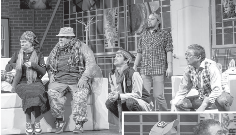
Замысловатый заголовок статьи? А что вы хотите: это под впечатлением от увиденного спектакля на оренбургской сцене драматического театра!

Еще одно обращение режиссера-постановщика, народного артиста РФ Рифката Исрафилова к творчеству самого известного британского драматурга-комедиографа современности, Рэя Куни. Писатель создал более 20 комедий («Клинический случай», «Девушка Гарли», «Номер 13», « Не сейчас, дорогая», «Слишком женатый таксист» и др), которые переведены на 40 языков мира. Английская критика отмечает, что «... юмор в пьесах Р.Куни может скатиться до уровня юмора известного комика Бенни Хила». Исследователи его творчества говорят что «...его комедии совмещают в себе традиционный британский юмор с замысловатым повествованием... сюжеты пьес взвинчены, остры... диалоги героев предоставляют неограниченные возможности для импровизации актеров и фантазии зрителей».