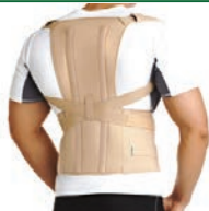
Бандажи, корсеты, стельки