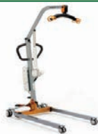
Подъемники для инвалидов