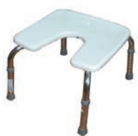
Кресла стулья с санитарным оснащением