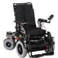
Кресло-коляски различных модификаций