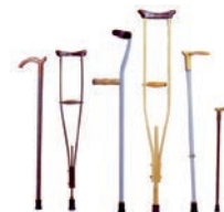
Трости, костыли различных модификаций