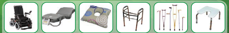
Современные средства реабилитации, противополежные системы, подушки, матрасы

Наш адрес: г. Оренбург, пр. Победы 2, «Центр ортопедии и протезирования», тел: (3532) 69-84-00, 27-54-00, e-mail: ortoped56@yandex.ru