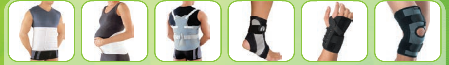
Бандажи, корсеты и ортезы

«Оренбургский салон-магазин» филиал федерального государственного унитарного предприятия «Московское протезно-ортопедическое предприятие» Министерства труда и социальной защиты Российской Федерации МЫ РЕАЛИЗУЕМ ШИРОКУЮ ГАММУ ТЕХНИЧЕСКИХ СРЕДСТВ ДЛЯ РЕАБИЛИТАЦИИ