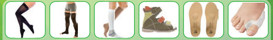
Медицинский компрессионный трикотаж (колготки, чулки, гольфы), ортопедическая обувь, стельки, приспособление для стоп