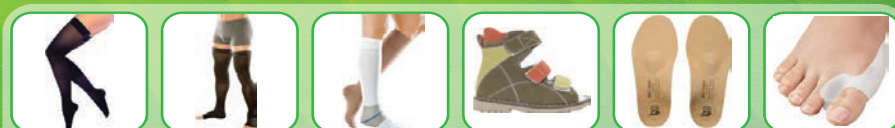
Медицинский компрессионный трикотаж (колготки, чулки, гольфы), ортопедическая обувь, стельки, приспособление для стоп