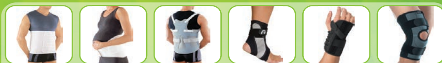
Бандажи, корсеты и ортезы

«Оренбургский салон-магазин» филиал федерального государственного унитарного предприятия «Московское протезно-ортопедическое предприятие» Министерства труда и социальной защиты Российской Федерации МЫ РЕАЛИЗУЕМ ШИРОКУЮ ГАММУ ТЕХНИЧЕСКИХ СРЕДСТВ ДЛЯ РЕАБИЛИТАЦИИ